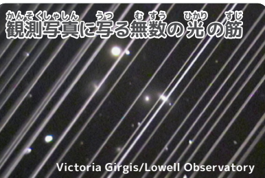
観測写真に写る無数の光の筋

[参考サイト]・SpaceX スターリンク低軌道衛星コンステレーションへの対応(国際ダークスカイ協会). https://darksky.org/news/starlink-response/ ・衛星群に関する国際天文学連合声明(国際天文学連合). https://www.iau.org/news/announcements/detail/ann19035/ ・通信衛星群による天体観測への悪影響についての懸念表明(国立天文台). https://www.nao.ac.jp/news/topics/2019/20190709-satellites.html