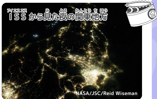
ISSから見た夜の関東地方

子供の頃から近視。大人になってようやく治り、生まれて初めて満天の星空を見て感動したのが今の仕事に就いたきっかけです。